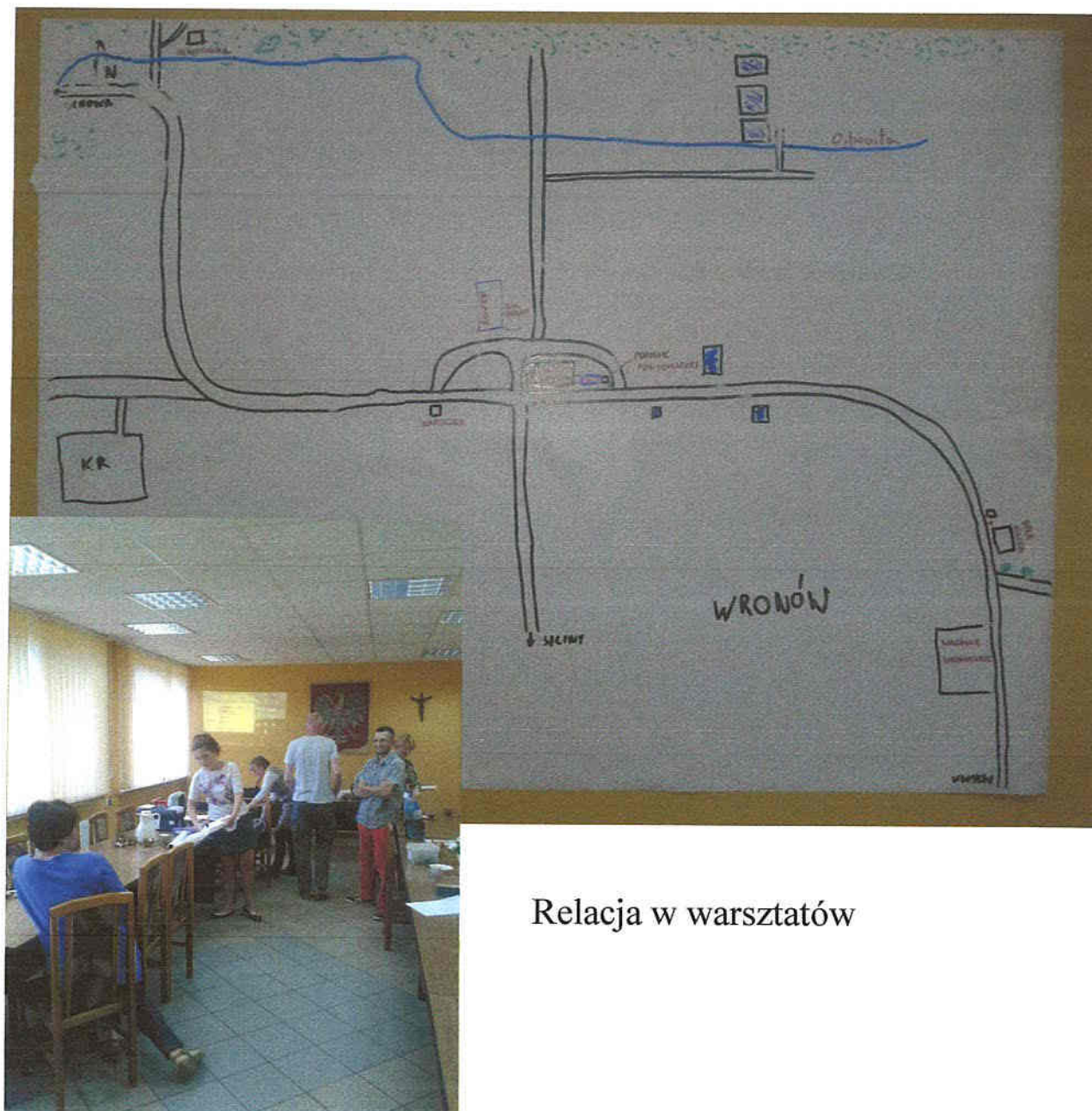
Relacja w warsztatach

Wronów to wieś z bezpieczną drogą, uporządkowaną, nowoczesną infrastrukturą techniczną i zadbanym środowiskiem. Mieszkańcy kontynuują tradycję zgodnej współpracy na rzecz rozwoju wsi angażując młodzież. Wronów ma zadbane i estetyczne posesje i zagospodarowane tereny zielone. Wieś jest dumna ze swoich licznych inicjatyw społecznych oraz jest dobrym przykładem dla całej gminy. Tworzy dobre i przyjazne warunki do osiedlania się nowych mieszkańców.