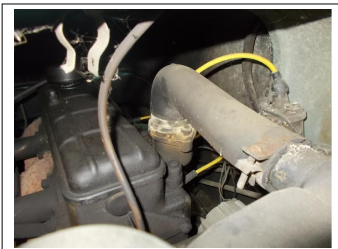
Fot. 15. Komora silnika