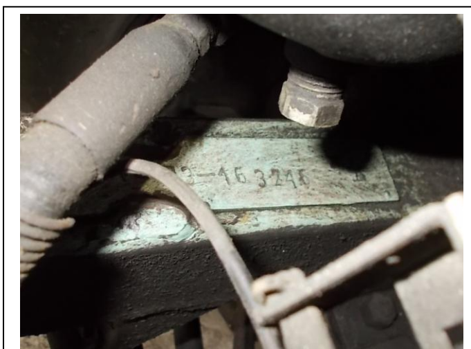
Fot.5. Numer identyfikacyjny