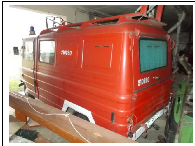
Fot.2. Widok ogólny tył strona lewa