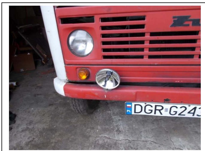
Fot.19. Uszkodzenia pojazdu