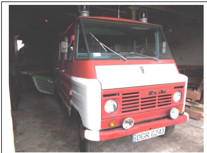
Fot.1. Widok ogólny przód strona prawa