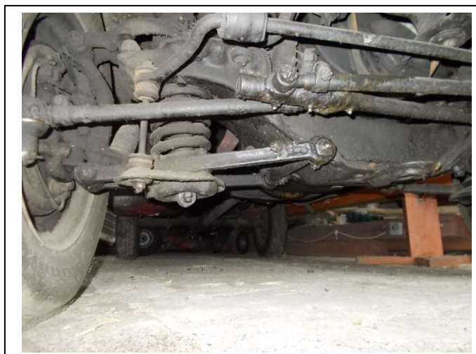
Fot. 16. Podwozie pojazdu