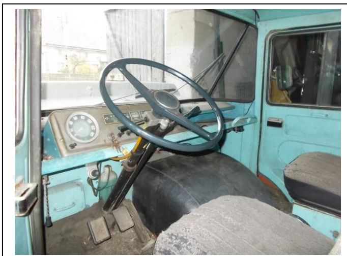
Fot.9. Wnętrze pojazdu