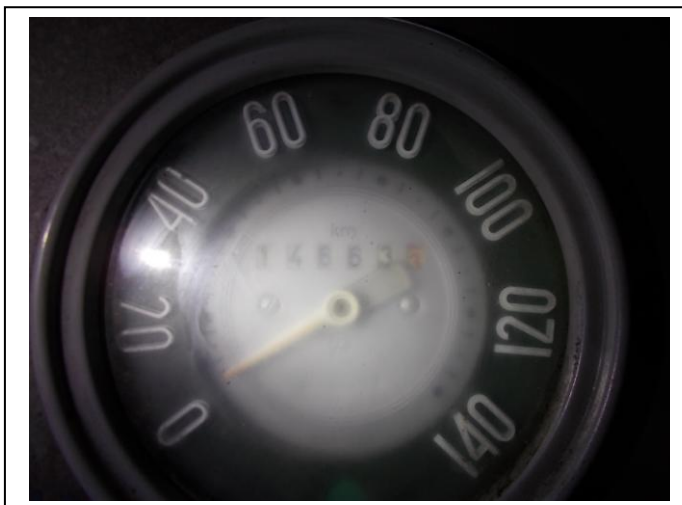
Fot.7. Wskazanie drogomierza