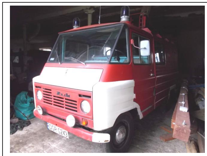
Fot.4. Widok ogólny przód strona lewa