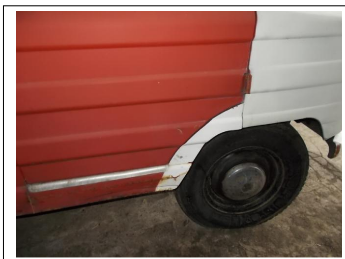
Fot. 18. Uszkodzenia pojazdu