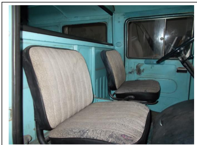
Fot.10. Wnętrze pojazdu