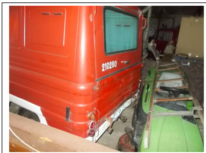
Fot.20. Uszkodzenia pojazdu