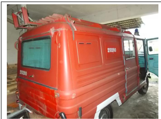
Fot.3. Widok ogólny tył strona prawa