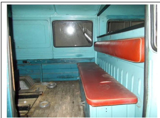
Fot 11. Wnętrze pojazdu