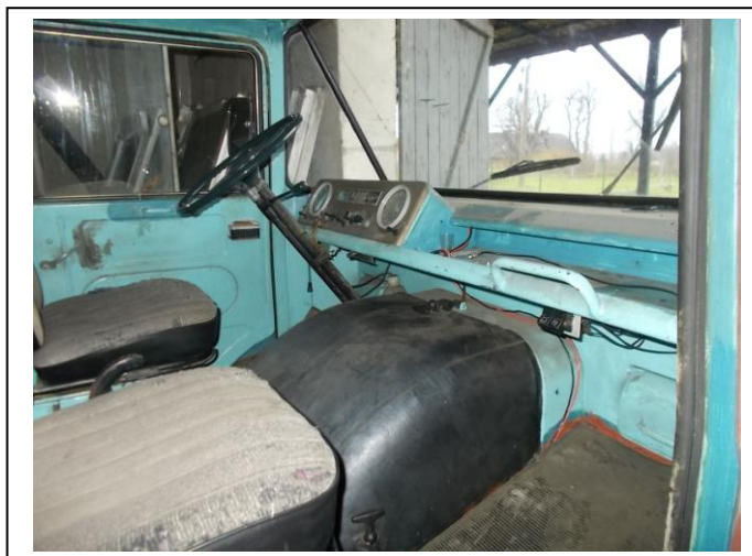
Fot.8. Wnętrze pojazdu