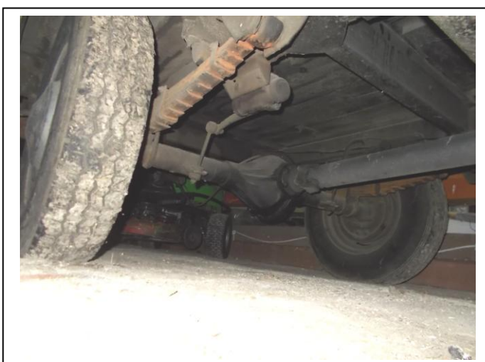
Fot. 17. Podwozie pojazdu