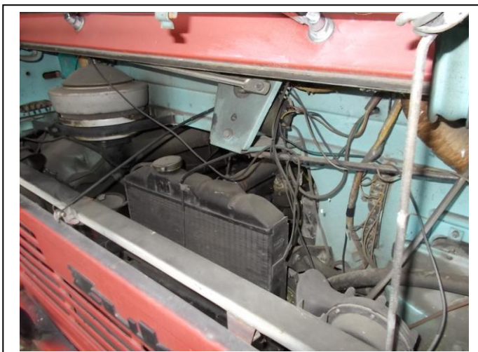
Fot. 13. Komora silnika