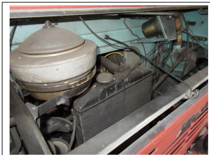
Fot. 14. Komora silnika