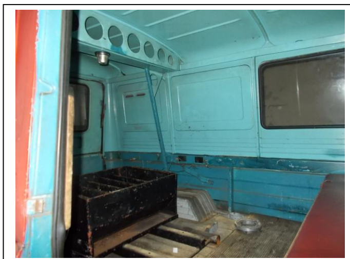
Fot 12. Wnętrze pojazdu