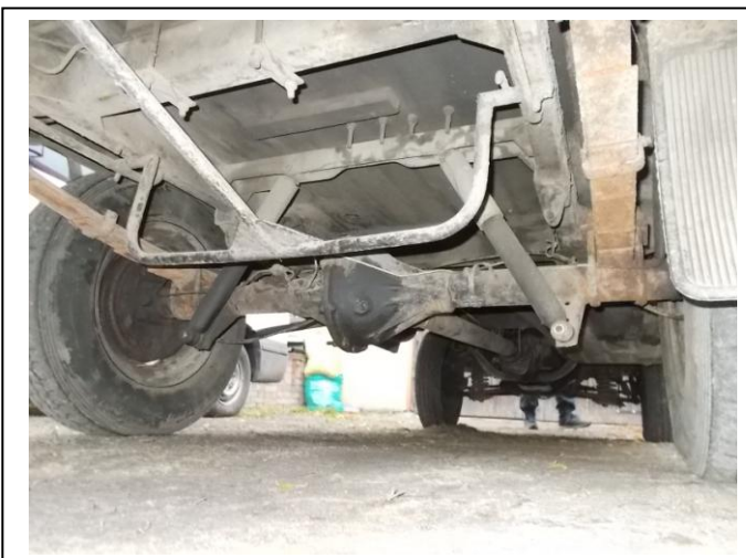
Fot. 17. Podwozie pojazdu