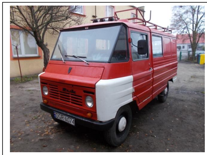
Fot.4. Widok ogólny przód strona lewa