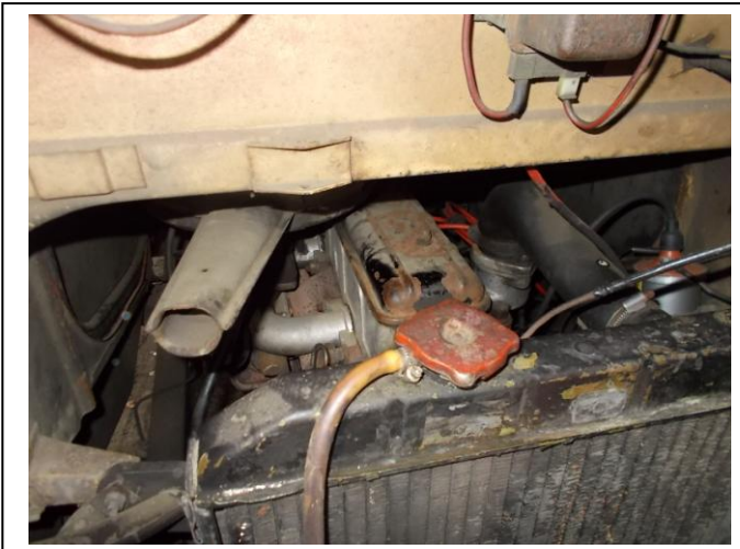
Fot. 15. Komora silnika