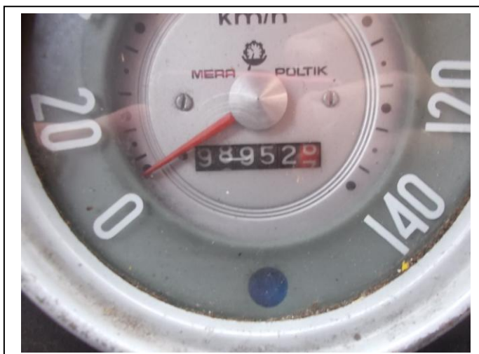
Fot.7. Wskazanie drogomierza