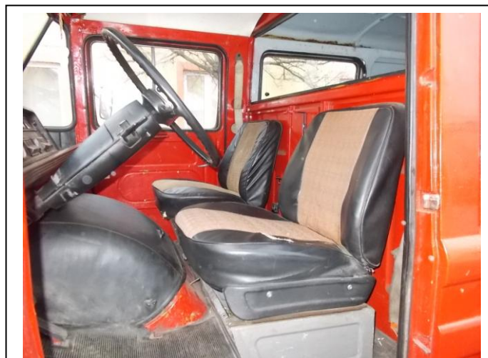
Fot.10. Wnętrze pojazdu