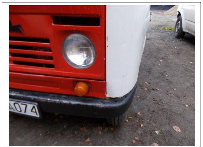
Fot. 18. Uszkodzenia pojazdu