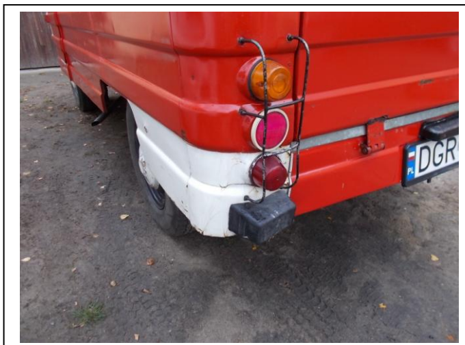
Fot.20. Uszkodzenia pojazdu