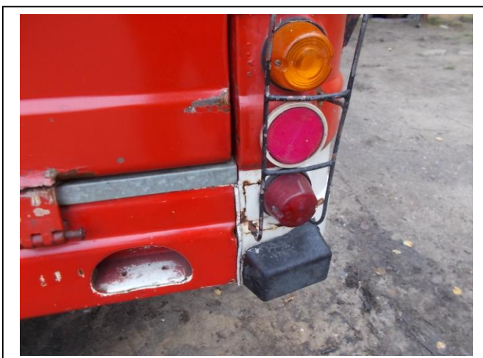
Fot 21. Uszkodzenia pojazdu