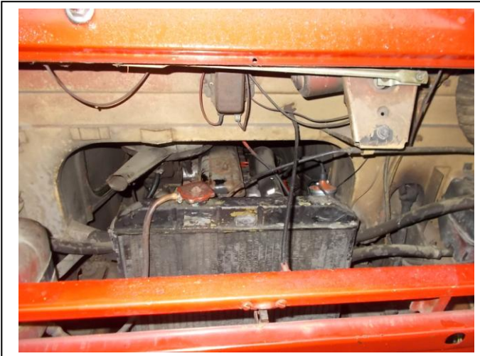
Fot. 13. Komora silnika