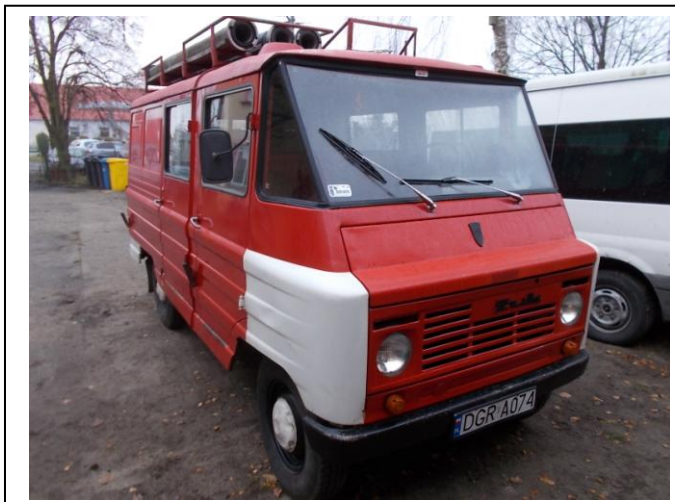
Fot.1. Widok ogólny przód strona prawa