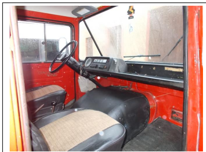
Fot.8. Wnętrze pojazdu