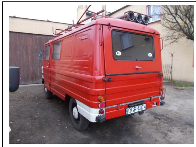
Fot.2. Widok ogólny tył strona lewa