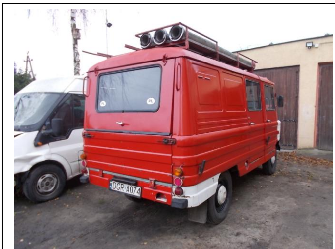
Fot.3. Widok ogólny tył strona prawa