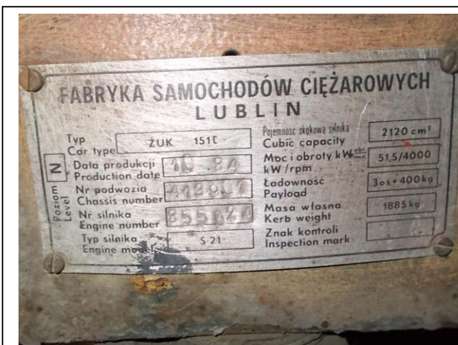
Fot.6. Tabliczka znamionowa