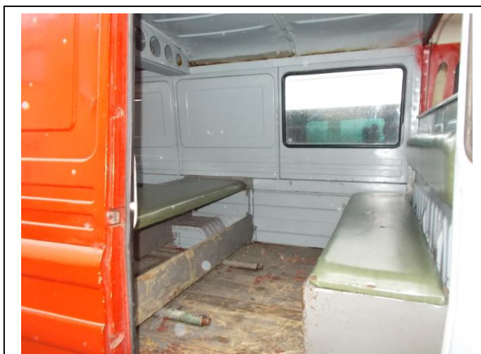
Fot 11. Wnętrze pojazdu