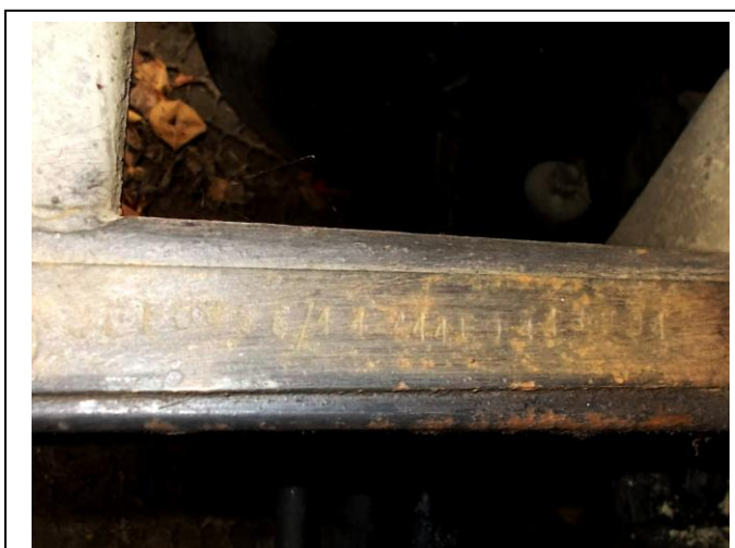
Fot.5. Numer identyfikacyjny