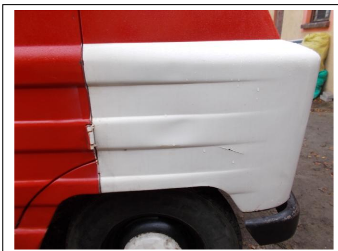
Fot 22. Uszkodzenia pojazdu