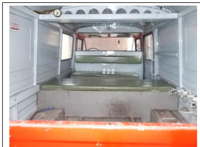
Fot 12. Wnętrze pojazdu