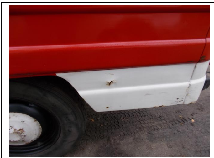
Fot.19. Uszkodzenia pojazdu