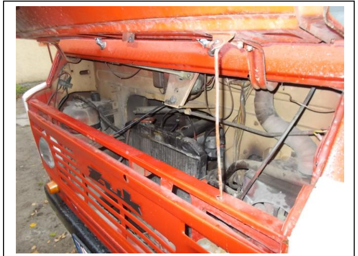
Fot. 14. Komora silnika