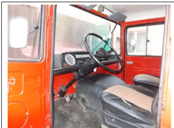
Fot.9. Wnętrze pojazdu